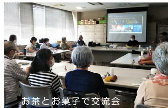
お茶とお菓子で交流会